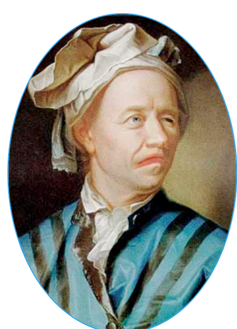
Leonhard Euler (1707-1783)